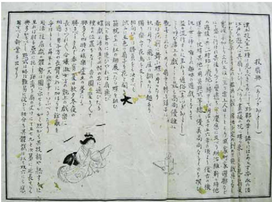
添付の「投扇興 （あふぎおとし）」 （大正時代）