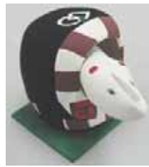
(図 2-5) 経蔵坊

「湖山長者」は鳥取を代表する昔話。陽のあるうちに田植えを終わらせたい長者が、日暮れを遅らせるという傍若無人な振舞いの報いで、すべての田畑が湖（今の湖山池）に一変する物語だが、廉兵衛氏の手になる湖山長者は、とぼけた表情が笑いを誘う（図 2-6）。