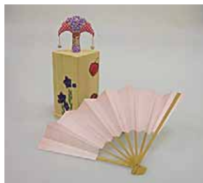
（図 1-1）投扇興の道具 （左上から蝶、枕、扇）