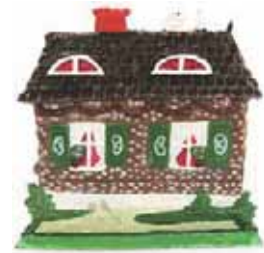
(図2-1) 錫細工「お菓子の家」表(上)と裏