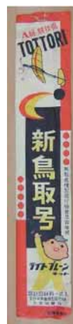
(図3-4) 模型飛行機「新鳥取号」

模型飛行機づくりは、戦前・戦中は国威発揚を担い、学校の教材に採用されたが、戦後には一転して採用取り消しの憂き目を見た。その後メーカー側の努力によって、再び図工や美術の教材として活用されるようになった(図3-3)。工作に適した接着剤の普及とともにブームが訪れた一品(図3-4)。