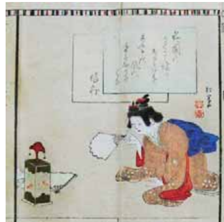
点数表の挿画、少女が遊ぶ（大正時代）