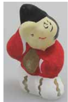
(図 2-6) 湖山長者