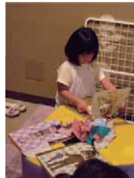
おもしろ着せ替え