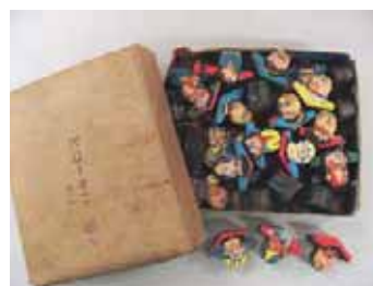
(図3-5) 飛行機型メンコ

メンコはこの時代に限った遊びではないが、この頃コートボール紙の普及とともに、印刷技術や形状加工が発展した(図3-5)。鳥取では「ゲンジイ」あるいは「ペッチン」などと呼ばれ、「ゲンジイ」の由来は、絵柄に源氏の武者絵が多かった頃普及したためとされている。