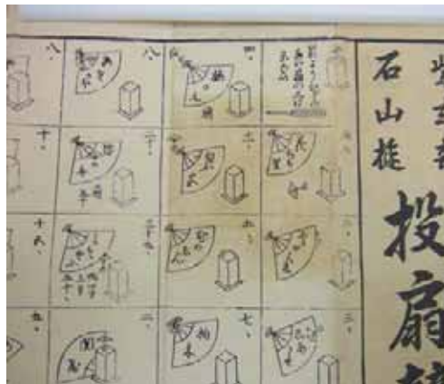
点数表（明治時代、部分）