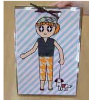
(図3-10) おもしろ着せ替え手順 ハギレの組み合わせを楽しむ

このように、素材の色や柄の組み合わせを楽しむ遊び方としては、年齢層では大体小学生以上が理解していた。組み合わせが完成したら、そのシートを他の子がリクエストするまで壁面に展示することで、自身の作品として愛着が芽生えていたようだ。