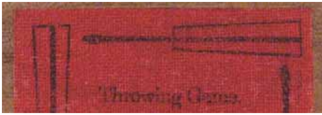
大正時代の枕の台座内部の部分 「Throwing Game」と英語表記