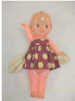
(図3-7) セルロイドのキュービー

そこへ塩化ビニール、ポリプロピレンなど合成樹脂が登場し、おもちゃの大量生産や加工の簡便性を後押しし