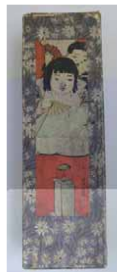
箱蓋（大正時代） 子どもが遊ぶ絵