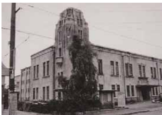
昭和30年代の旧県立図書館 （わらべ館はこの建物を復元）