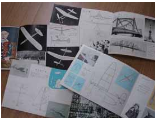
(図3-3) 昭和30年代の教科書(図画美術・工作)

これの醍醐味は、自分の工作技術を試し、向上させられることと、その結果、飛行距離の延長という目に見える達成感が得られることだろう。これは子どもに限らず、大人も夢中にさせるもので、週末ともなれば、鳥取砂丘を舞台に競技会が繰り広げられていた。