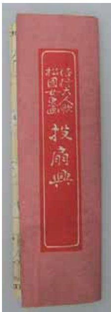
添付された点数表の表書き 「松園女史」とは上村松園か （大正時代）