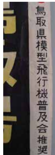
(図3-9) 外袋 (部分)