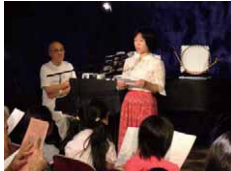
ドイツ語の歌を楽しみ…

「三枚のお札」…小僧が山姥から逃れる際に、3回まじないをかける。昔話に現れる「3」の世界的な共通性。