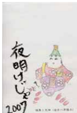
(図4-7) 輪郭を絵手紙用のはがきにプリント。 作品例