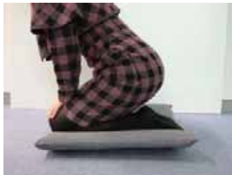
（図1-4）腰を浮かせない