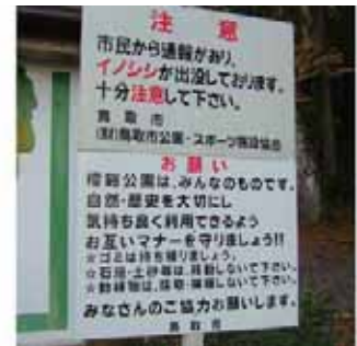
鳥取市民の憩いの場にも現れる

縄文時代から貴重なタンパク源のごちそうとして捕らえられてきたため、ただ食べるだけでなく、祭礼に捧げ、食後の骨は占いに用いるなど、天恵という認識に裏付けられた行為がうかがい知れる。弥生時代には、骨 こつぼく と あおや いって、シカやイノシシの肩甲骨に熱した棒を押し当てた焦げ目で吉兆を占う習慣があった。鳥取市 あおや 青谷町にある かみじち 青谷上寺地遺跡からは、全国でも最多のト骨が見つかり、肩だけでなく下あごの骨も同様の状態で出土した(『青谷上寺地遺跡の弥生人と動物たち』鳥取県教育委員会、平成18年3月)。