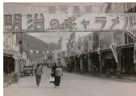
昭和30年代の若桜街道（県立公文書館蔵）