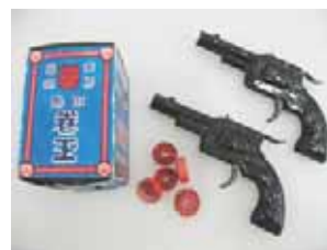
（図 3-2）ブリキの銃と巻き玉

戦時中に製造を禁じられたブリキ製おもちゃだが、戦後、紙火薬の製造が許可されると、銃とともに単発の「平玉」や連発の「巻き玉」が普及した。これを装填して引き金を引けば発射音が響き、火薬臭が立ち込め、誰もが西部劇や冒険活劇のヒーローになれた。ちなみに、本資料を見た 50 歳台のドイツ人男性が「自分も当時そんな遊びをしていたよ」と語るように、東西ヒーローごっこの必須アイテムと言ってもいいようだ（図 3-2）。