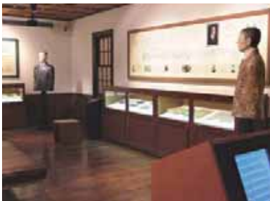
鳥取の音楽家たちの部屋