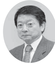
鳥取県知事 片山善博

先日、二歳半になる孫娘を連れてわらべ館を訪ねました。彼女が最も目を輝かせたのが音階のコーナーで、そこを離れようとはしませんでした。私が一番長くいたのは童謡唱歌が聞こえる教室です。この教室は、時折訪ねてくる両親にとつても教員生活を思い出す格好の場所となっています。子供には楽しい夢を与え、大人には暫し昔日を懐かしむ空間を提供する。わらべ館のミッションの一つは、この機能を提供することにあります。