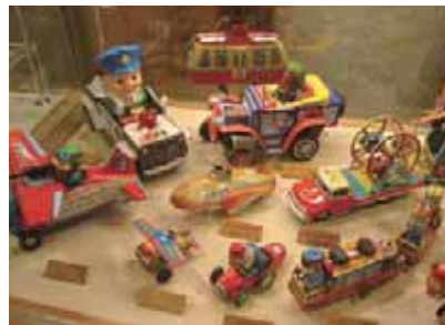
3階 なつかしいおもちゃがいっぱい