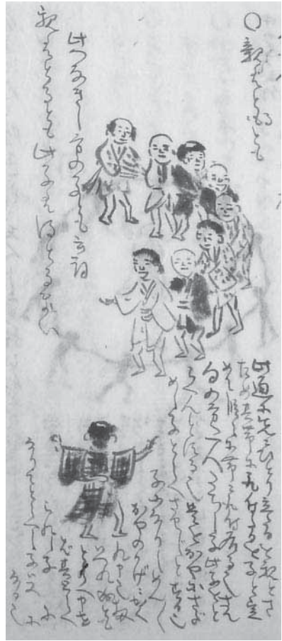
親はとるともの図