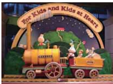
エントランスモニュメント